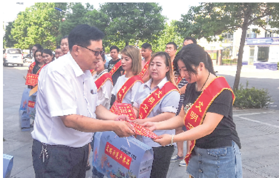
颁奖现场

信阳消息(记者 李倩) “太开心了,这次能够评上文明卫生示范户,是政府和居民对我们的认可。”为打造优美环境,共建文明和谐家园,进一步助力我市创建全国文明城市工作,近日,浉河区五星街道秀水社区在春华路举行了首批“文明卫生示范户”表彰仪式,向获此荣誉的商户颁发了奖品及奖牌,号召辖区全体商户向他们学习,鼓励居民人人参与到