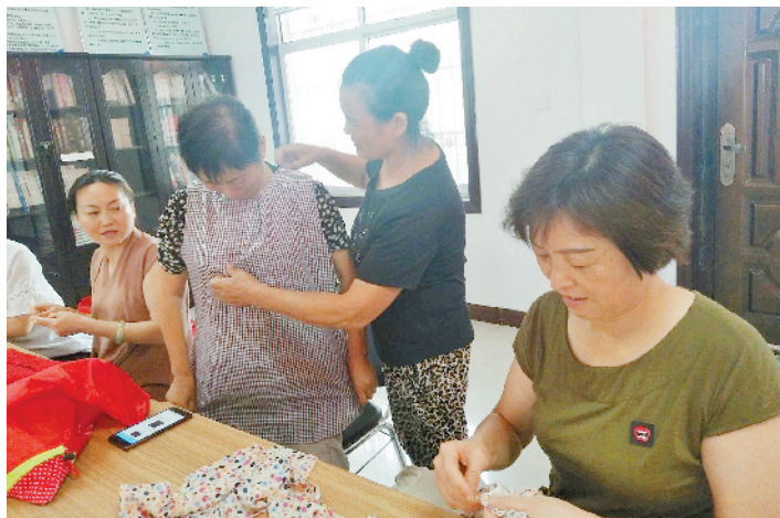
居民改造旧衣服

信阳消息(记者李倩)衣服破了旧了,不想穿,扔了又可惜,怎么办呢?浉河区华夏路社区就有一群能变废为宝的达人。近日,浉河区湖东街道华夏路社区组织居民开展旧衣改造DIY活动,吸引数十户家庭踊跃参加,大家各展巧手,用行动展示勤俭持家的良好传统。