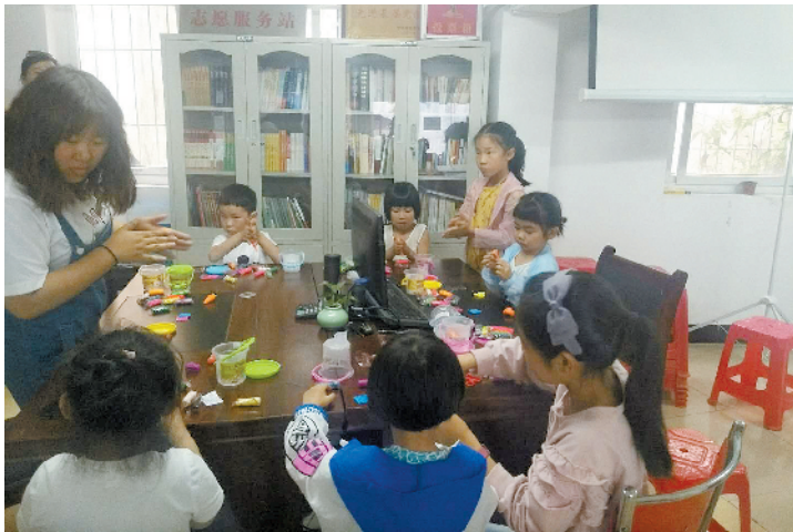
孩子们跟志愿者学习彩泥制作

“社区每个月都会开展这样的特色活动,你看今天孩子们在这儿玩得多开心啊!孩子们能够