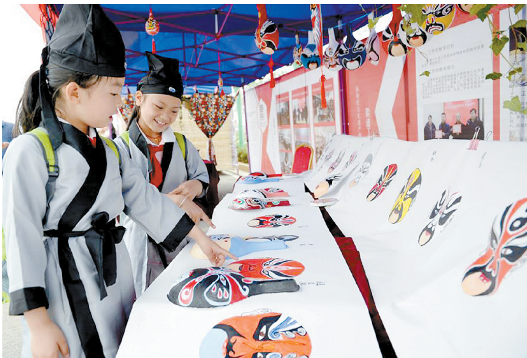
6月1日,学生在陕西少儿美术教育成果展上参观脸谱绘画作品。

当日,陕西少儿美术教育成果展在西安西咸新区空港新城西安国际美术城举行,来自陕西各地的万余名师生欢聚一堂,展示交流近年来少儿美术教育的丰硕成果。