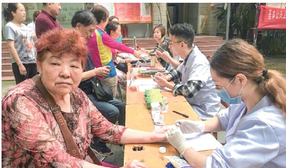
为进一步提高辖区居民健康意识和自我保健能力,近日,浉河区金牛山街道计生办联合华森社区卫生服务中心开展公共卫生服务“进机关,进企业,进学校,进社区,进乡村”五进活动,免费为华森社区居民检查身体,提供健康咨询服务。