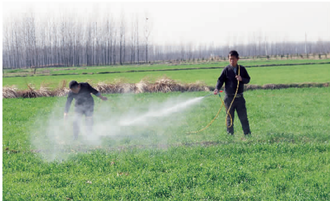
3月11日,光山县仙居乡张湾村青春合作社社员正在麦田喷洒除草剂。时下正是春耕备播和田间管理的关键时期,该县农民抓紧施肥、除草、灌溉,为今年夏季小麦稳产增收打下良好基础。

甚至是大项目支撑经济发展。”淮滨县长梁超颇有感触地说。2017年,淮滨县共谋划各类固定资产投资投资项目402个,纳入当年省、市、县三级重点项目191个,年度计划投资116.9亿元,完成投资109.7亿元,占项目年度投资额的93.83%,有效支撑了全年经济社会发展。2017年该县多项主要经济指标领跑全市,其中全年固定资产投资完成196.6亿元,增长18.3%,位居全市第二。2018年,该县继续深化项目建设年活动,谋划固定资产投资投资项目483个,总投资632亿元,年度推进重点项目259个,计划完成投资149亿元,是历年之最。