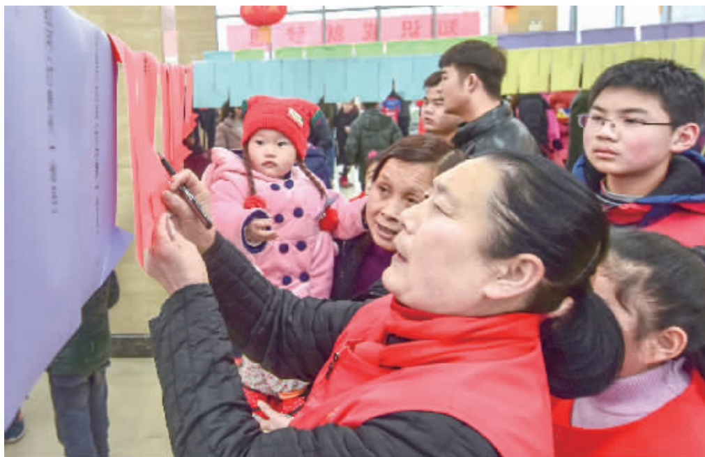
3月1日,为了让传统的元宵节更温馨祥和、吉祥喜庆,罗山县专门组织文化部门开展系列“春满中原 欢乐元宵”猜灯谜闹元宵活动,精心准备了包括地名、动植物、成语、日用品、科普知识等2000余条谜语,吸引了广大城区居民积极参与。图为竞猜现场。

实施重大项目惠民生。该区围绕出山店水库移民安置工程,计划4月底前完成所有移民搬迁入住、防护工程全部完工。实施重大产业项目,解决市民就业问题,该区通过招商引资,引来总投资30亿元的恒信汽车新材料项目,预计10月底一期建成投产;总投资15亿元的光电产业园项目,预计4月底完成征地拆迁。这些强区富民的大项目,既能解决就业,又能引领工业发展。