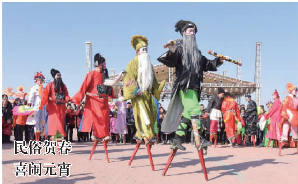
民俗贺春 喜闹元宵