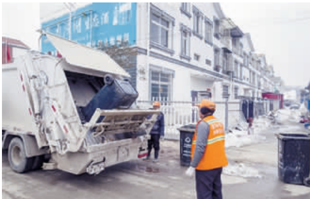
全自动垃圾清运车清理垃圾