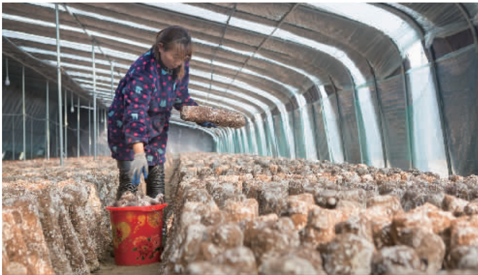
2月25日,新县酒店乡邹河香菇种植基地的工人正在收获香菇。该基地注重扶贫带贫,目前已吸纳贫困户就业100多人次,带动贫困户每人每天增收70元至100元。