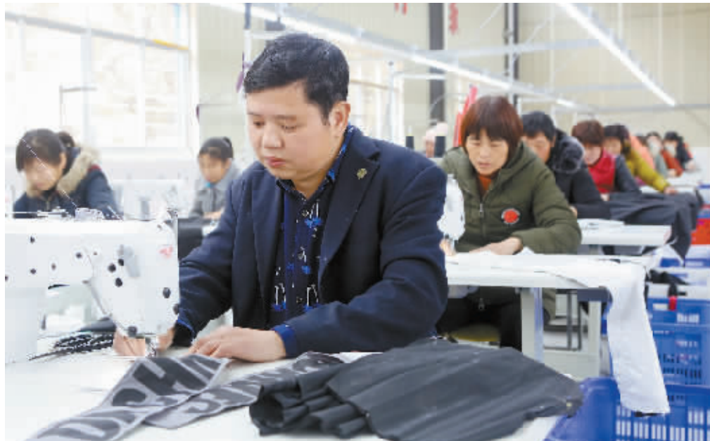
2月24日,农历正月初九,新县浒湾乡华兴服饰有限公司扶贫车间里一派繁忙的生产景象。该扶贫车间提供就业岗位 130 多个,让贫困户在家门口实现就业,月均增收 4000 左右。

本次活动抓住外出务工返乡人员回乡庆贺新年的节点,以“助力精准扶贫,推动返乡创业,服务企业用工”为主题,通过条幅、网络、电子屏、电视滚动字幕等多种方式和渠道宣传招聘会信息,让信息深入各乡镇、各村,扩大招聘会的知晓面,努力搭建用人单位和求职人员尤其是贫困劳动力的对接平台,引导和鼓励在外务工人员能够回乡就业、创业,拓展就业渠道,完善精准服务,强化困难帮扶,积极将就业岗位和政策送到更多百姓家门口,让就业春风惠及更多返乡务工人员。