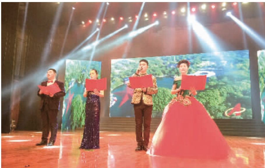
拼搏发展,感恩奉献。昨日下午,市供水集团公司第七届“供水情”企业文艺汇演在文化中心举行。歌舞、诵读、相声、魔术……精彩纷呈的节目,展示了信阳供水人的不凡才艺和良好的精神面貌。图为汇演现场。

招聘会结束后,记者从市人社局了解到,招聘会现场签约达成就业意向2890人,吸引贫困户家庭劳动力57人前来应聘。