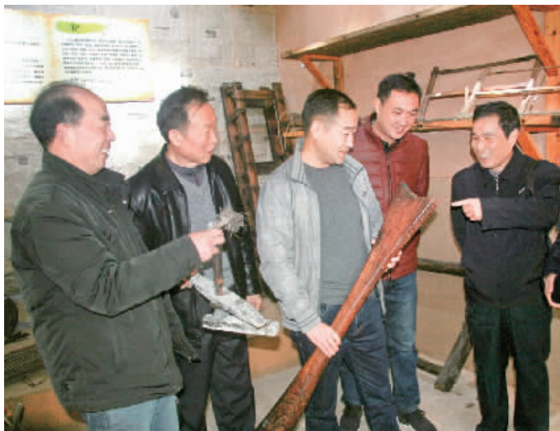
为了保护、存留、展示和研究淮河流域传统农耕文化,最近,平桥区明港镇在新集村农家庭建起了一座淮河流域农耕文化展览馆。这些传统的农耕器具,在过去漫长的历史岁月中体现出前人生存的勤劳和智慧,见证了淮河流域农耕文化的沧桑巨变。图为游人们正在听取农耕器具用途情况的介绍。