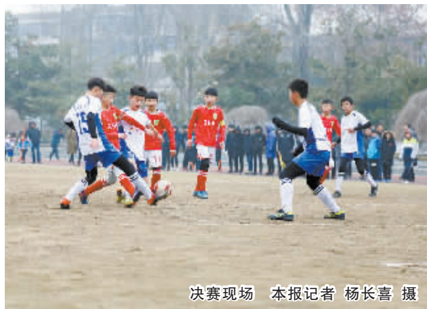
决赛现场

最后一场比赛在浉河中学和三五八中学之间进行。上半场的时间里,三五八中学率先攻入一球,并将1:0的比分保持到了中场结束;下半场的时间里,浉河中学发起攻势,并率先攻破对方球门,扳平了比分。但随着比赛的继续,浉河中学未能发挥身体更加高大强壮的优势,反观三五八学校球员意识更加敏锐,技术更加细腻,配合更加娴熟,在10分钟的时间里连续打入3球,并将4:1的比分保持到比赛结束。最终,三五八中学获得冠军,浉河中学获得亚军;在之前进行的三四名角逐中,浉河