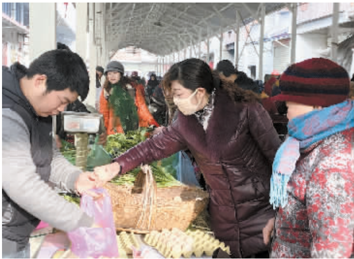
市民忙囤菜

信阳消息 (记者 马依帆) 临近春节,雨雪天气对市民的“菜篮子”有着直接的影响。听说我市将再次迎来一场降雪,不少市民都忙着囤菜。