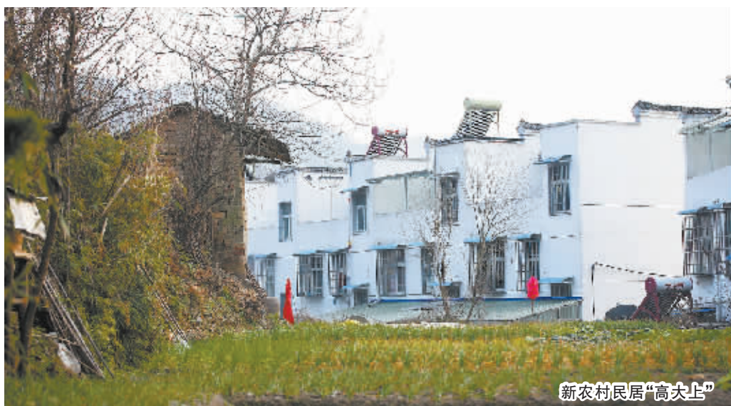
新农村民居“高大上”