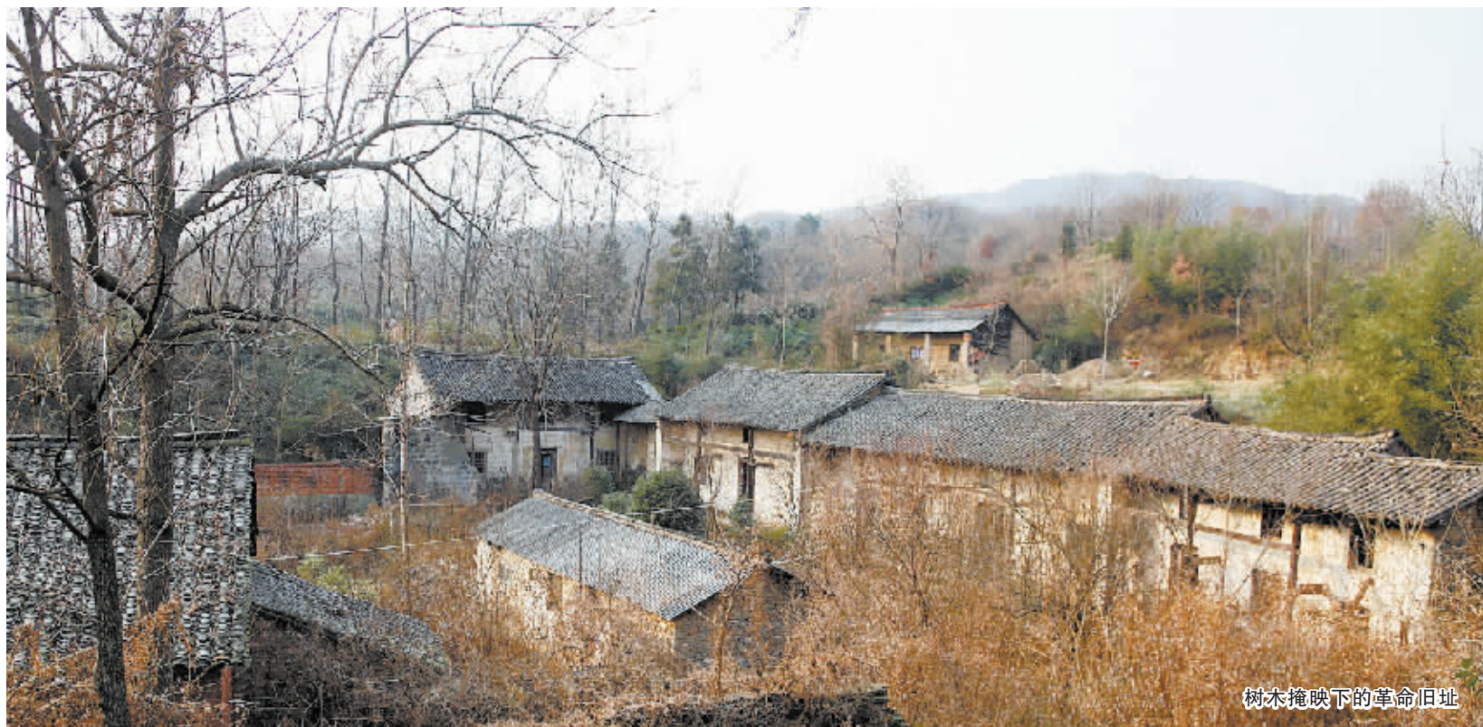
树木掩映下的革命旧址