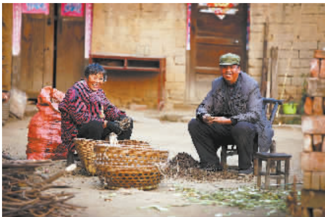
收获药材，老两口很开心