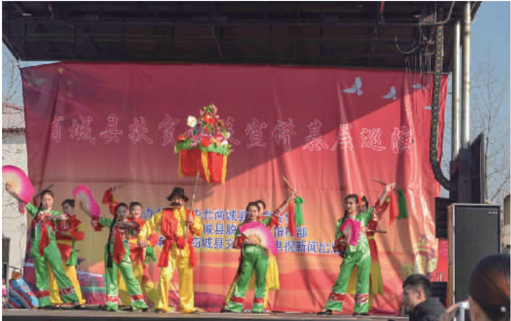
12月19日,由商城县委宣传部、县扶贫攻坚指挥部主办,县文广新局承办的商城县扶贫政策基层巡演活动在李集乡朱围孜村隆重举行。据悉,该县专门成立了一支扶贫政策宣传文艺工作队,用歌舞、说唱、小品、火绦子等生动活泼的演出形式将国家扶贫政策送到百姓家门口。

与此同时,该县对主城区道路实行非绿标车、大型货车、工程渣土车区域限行,引导过境车辆避开主城区行驶。积极开展散煤流通集中检查专项行动,发动乡镇、村、社区各级干部,对“双替代”用户逐一入户确认、核查,扩大电代煤、气代煤范围,加强对劣质散煤的生产、销售环节监管和查处,目前已查处4家劣质散煤销售点。