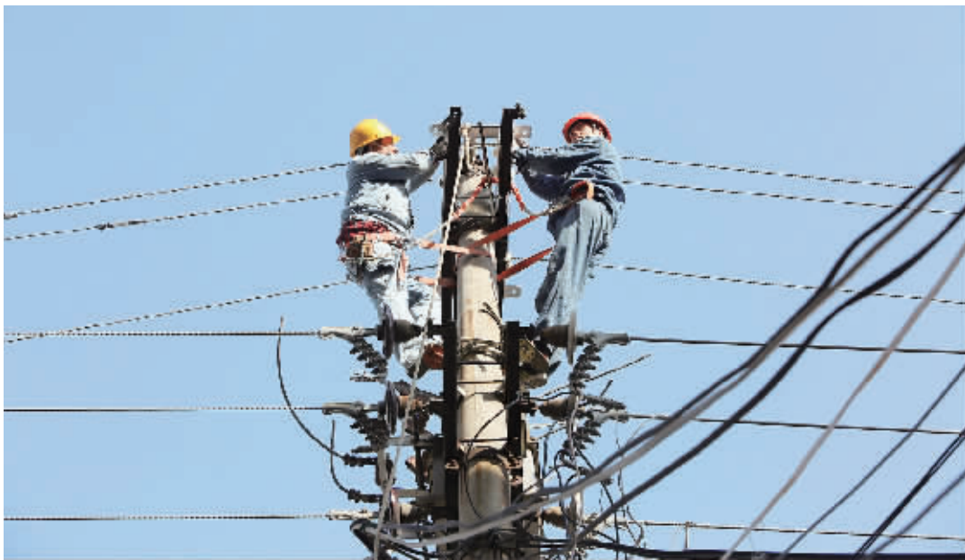
近日,淮滨县供电公司绝缘化升级改造城区4条10千伏线路14千米、更换低压主干线3千米、更换真空开关3台,改造后的导线横截面积从70平方米增大到240平方米。此次绝缘化升级改造,使淮滨城区形成了“手拉手”环网供电,将进一步提升城区电网安全运行水平,优化电网布局,有效降低自然灾害及外破安全隐患,为地方经济发展及迎峰度冬提供有力的电能保障。

据悉,截至目前该县“清河行动”共清理河流33条,开展县级河长巡河111人次,出动人员5314人次,机械182台,清除垃圾杂物2391立方米,涉河违章建筑15处,取缔非法采砂点5个。