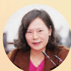
羊山外国语小学 副校长

“小记者,大影响。无论是学习培训还是实践采风,丰富多彩的小记者活动让家长放心、孩子受益、学校满意。对此,社会各界都给予了充分的肯定。”