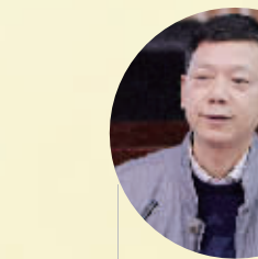
信阳晚报社社长、总编辑

“在团市委、市教育局以及各教育部门和学校的共同努力下,《信阳晚报》小记者学校充分发挥新闻媒体在未成年人思想道德建设中的独特作用,为加强青少年思想道德建设提供了一个新的窗口和平台,成为我市未成年人思想道德建设的新亮点。”