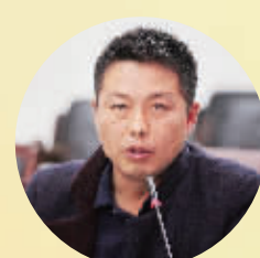
平桥区二小副校长

“《信阳晚报》小记者学校对孩子的培养用心、用心,不仅提供了多样化的平台,也是新闻人对青少年的关心关爱。”