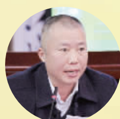
小记者社会实践活动基地代表、信阳市文新茶叶公司副总经理

“小记者工作将报纸采访和社交能力培养结合起来,将小记者教育与学校教育、家庭教育、社会教育有机地结合起来,对孩子身心成长都十分有益。”