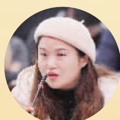
平桥区一小副校长

“参加小记者活动让小记者们更多地走向社会,走向大自然,在快乐中观察、认识社会,观察写作能力、为人处事能力、综合素质都得到很大提升。”