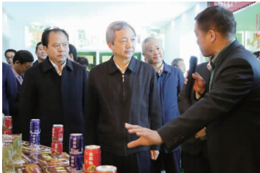
11月27日至28日,市长尚朝阳带队对全市转型发展和产业集聚区建设情况进行观摩。

信阳消息 (记者 李海)11月28日,全市转型发展攻坚推进会议召开。会议以党的十九大精神为指导,深入贯彻落实全省转型发展攻坚推进会议精神,动员全市上下进一步统一思想、凝心聚力、务实重干,全力打好转型发展攻坚战,为建设“五个信阳”、决胜全面小康,开启新时代信阳全面建设社会主义现代化新征程提供坚强持久的支撑。