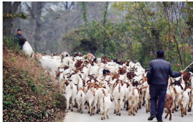
幸福村民,悠然放羊