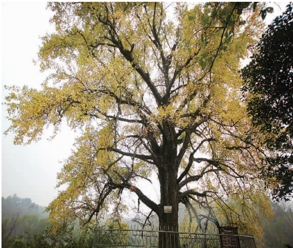
千年银杏,一身金黄