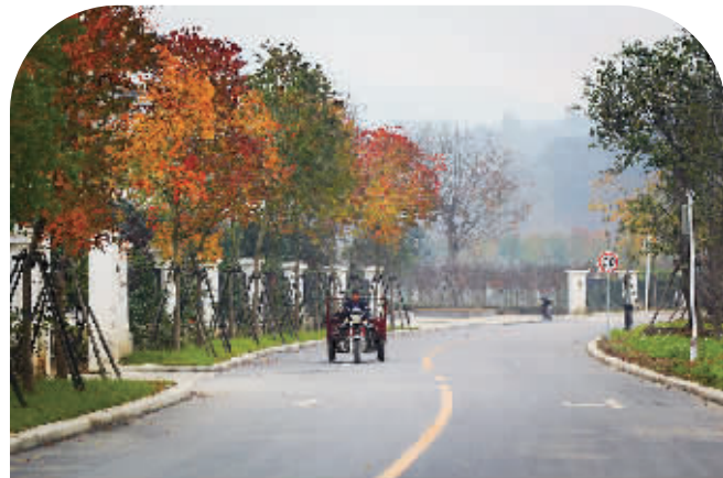
村口马路,干净宽敞