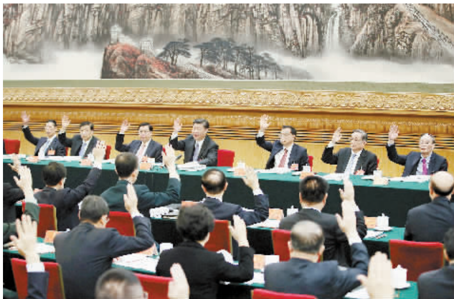
10月23日,中国共产党第十九次全国代表大会主席团在北京人民大会堂举行第四次会议。习近平、李克强、张德江、俞正声、刘云山、王岐山、张高丽等出席会议。