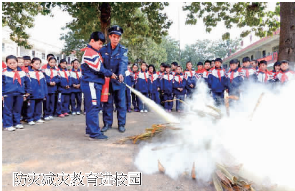
防灾减灾教育进校园

10月12日,河北省邯郸市西大夫庄小学学生在安保人员的指导下进行灭火演练。在第28个国际减灾日到来之际,河北省邯郸市西大夫庄小学开展安全教育进校园活动,旨在提升学生们安全意识,增强学生们的自救互救能力。