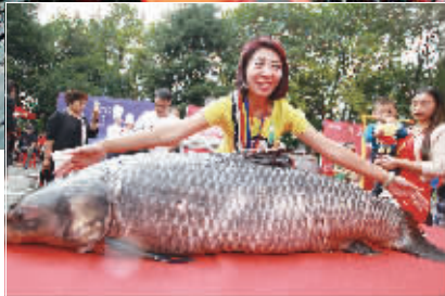
▲起鱼喽 ▲好大一条鱼