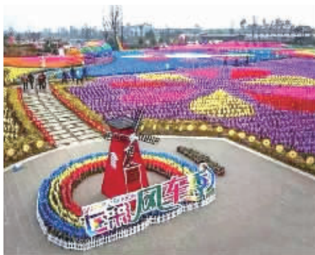
新县七彩风车欢乐蝴蝶谷游乐园

十一期间,新县卧佛山庄七彩风车欢乐蝴蝶谷游乐园开园,5万支五彩风车将盛情绽放,蝴蝶谷美丽精灵的存在让世界变得更