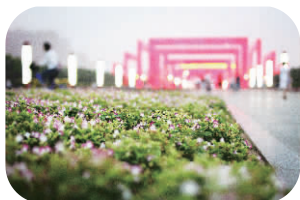
灯火荧荧,暗香幽幽