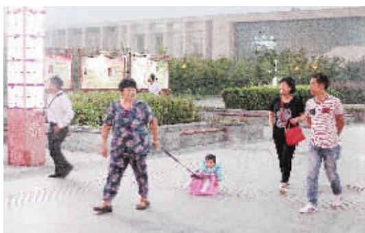
一家老小惬意游园