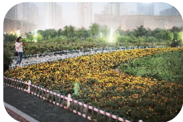
夏花似锦,引人驻足