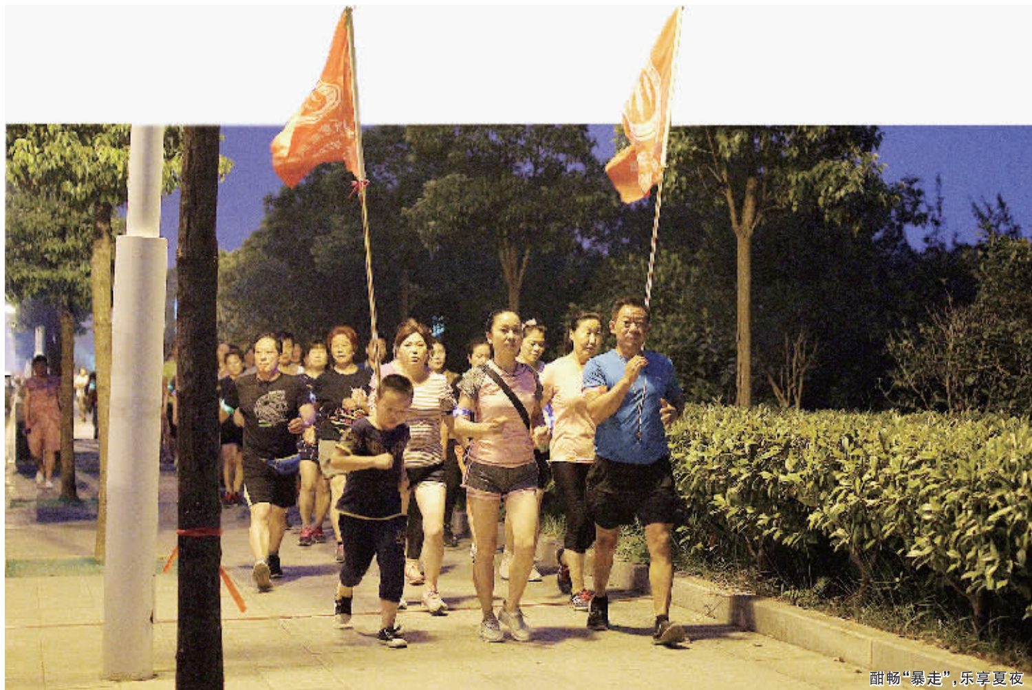
酣畅“暴走”,乐享夏夜