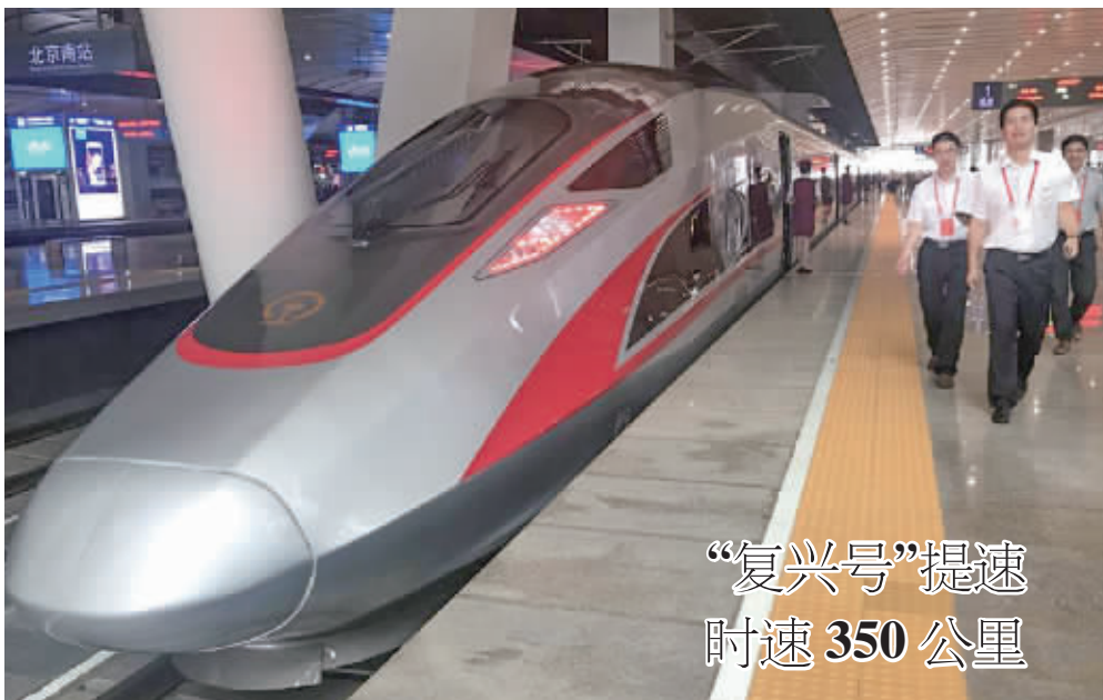
“复兴号”提速 时速350公里

据悉,中国人民解放军建军90周年前夕,中央军委将举行仪式向有关人员颁授新设立的“八一勋章”。