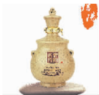
鸡公山信阳名片酒