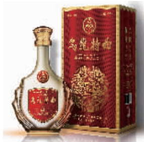
乌龙特曲 700ml 珍品