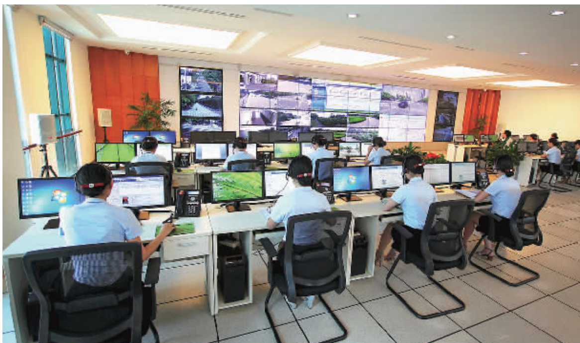
市城市数字化管理中心指挥大厅