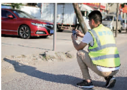
冒着酷暑,记录路面破损情况