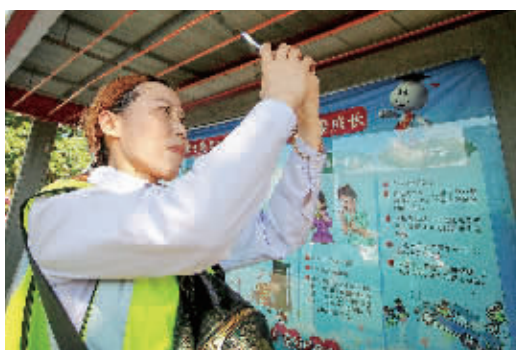
记录广告牌灯箱破损情况