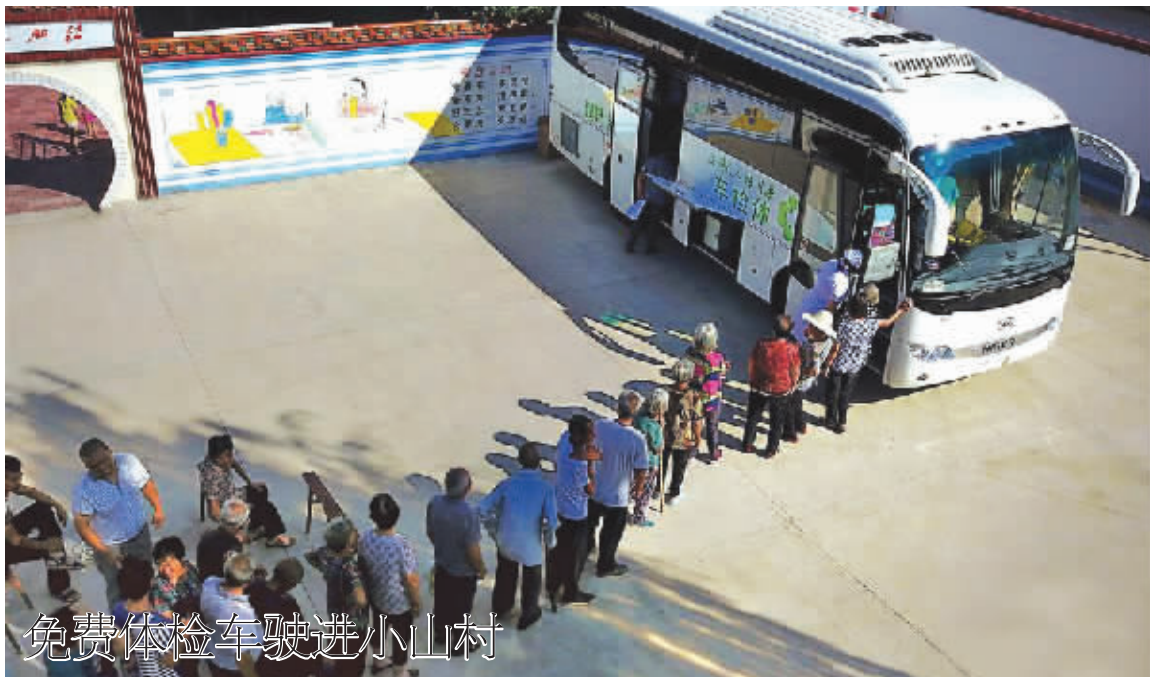
免费体检车驶进小山村

墨西哥国家人权委员会表示,已经展开对这起案件的调查,受害的孩子及其家庭将得到必要的医疗和心理援助。(据新华网)