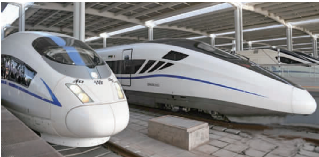
7月9日,兰州铁路局开行的首趟宝兰高铁G2028次动车组(左)在兰州西站等待发车。

在由“一带一路”沿线20国青年参与的评选中,高铁、支付宝、共享单车和网购被称为中国“新四大发明”。曾以古代“四大发明”推动世界进步的中国,正再次以科技创新向世界展示自己的发展理念。