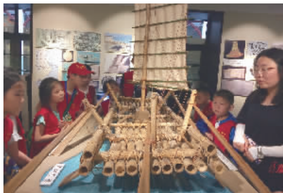
参观上海交大钱学森图书馆