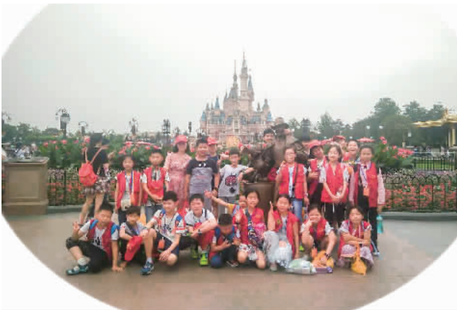
终于走进梦寐以求的迪士尼乐园

信阳消息 (记者 张 晗 王 洋)昨日,由信阳晚报社小记者学校举办的“撒欢吧,少年”上海迪士尼科技探索夏令营圆满结束,6天5夜的探索之旅,晚报小记者都是怎样度过的,他们有哪些收获?让我们一起跟随他们前行的步伐一探究竟吧!