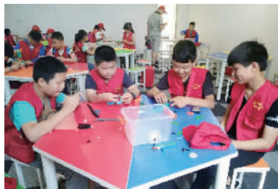
上海动漫馆内拼装模型