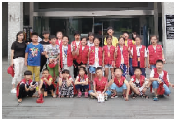
小记者在中国杭州工艺美术博物馆合影留念