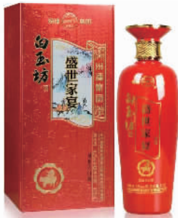
杏花村汾酒集团42度盛世家宴喜庆版

“借问酒家何处有,牧童遥指杏花村”,唐代大诗人杜牧一句经典绝唱,使得山西杏花村汾酒名扬天下、家喻户晓,奠定了杏花村汾酒在中国千年酒文化中的地位。为了让信阳市民感受中国酒文化的千年底蕴,品尝醇香四溢的中国名酒,特在我市举办大型百元连号钞,兑换汾酒集团盛世家宴的品鉴活动!限时又限量;活动只限5天;信阳限兑5000箱,兑完即止;机会只有一次,请各位爱喝酒的读者朋友千万不要错过这次机会!