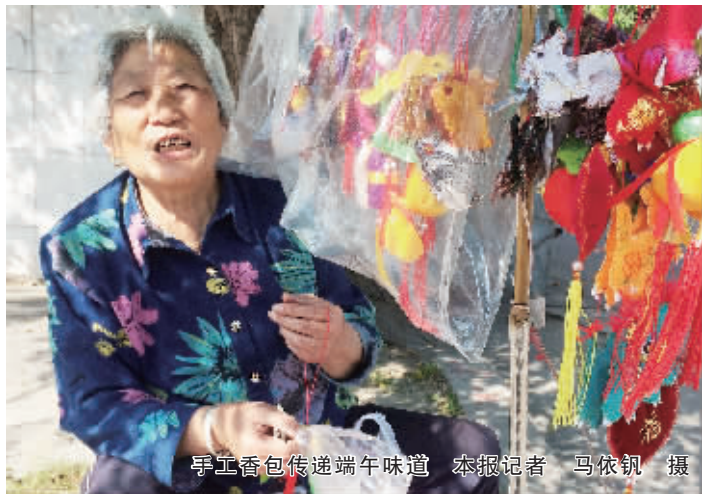
手工香包传递端午味道

信阳消息(记者 马依钊)端午节将至,飘香的不只粽子,还有香包。在申城大道曾家园小区,住着这样一位老人:她衣食无忧,却手工制作上百个香包,每逢端午节前就在小区门口摆摊出售。