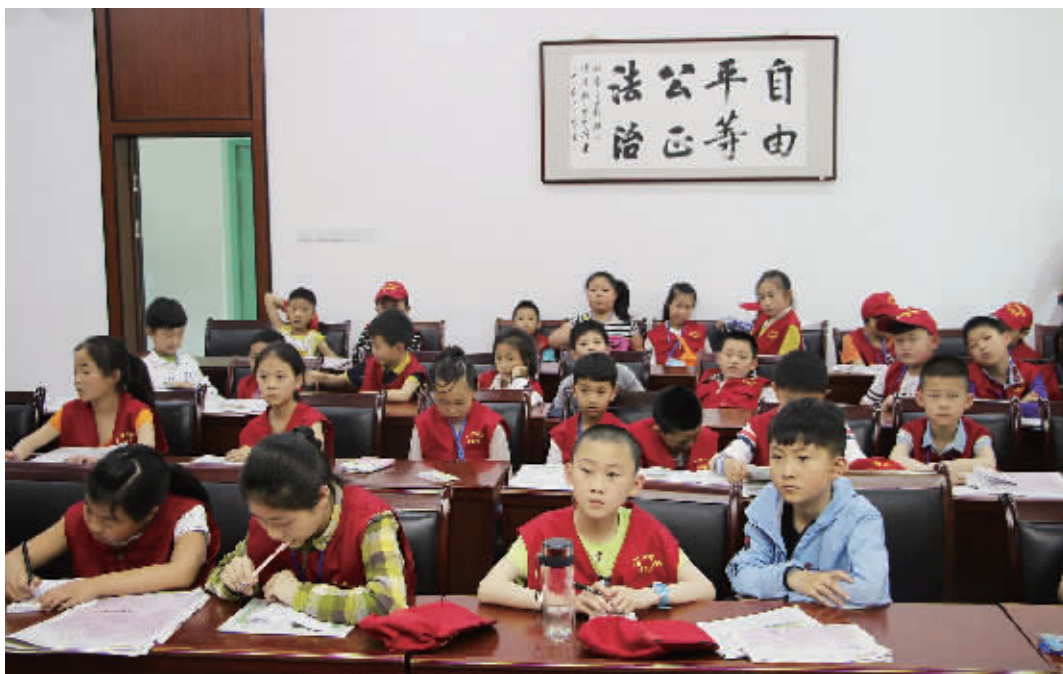
培训班上,小记者们聚精会神地听讲

信阳消息(记者 王洋)写作是语文学习中的一项重要内容,同时也是培养孩子思考能力、阅读能力和分析能力的重要途径,但在日常学习中,不少孩子对写作怀有畏难情绪。5月13日上午,信阳晚报社小记者学校举办“跟着名师学作文”培训班,80余位小记者现场向信阳金色童年寄宿学校的两位名师“取经”,老师现场为小记者们答疑解惑。