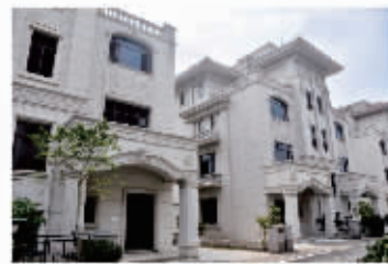
项目案例一:广东惠州碧桂园项目