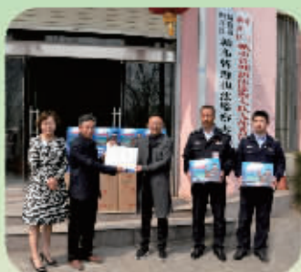
因为东北商会与浙河区法院大队捐赠而举行的场景

在信阳和东北紧密联谊高速发展状态下结出了一个丰硕的果实——信阳市黑土地不夜城酒店,是信阳市东北商会旗下的首个联合企业,为信阳美食又增添一道亮丽的色彩。