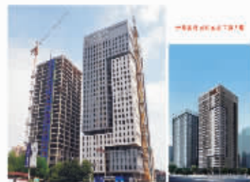
项目案例二:万科·翡翠国际项目