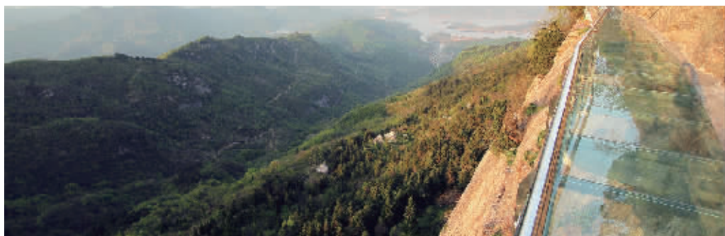
狮头岭上的玻璃栈道