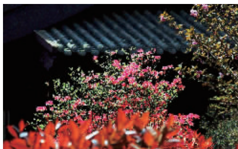
李贽书院里的杜鹃花

夜幕降临后，再伴着法眼寺的钟声看此山，有日月星辰的流转，也有风霜血雨的洗沥，依旧是那样的俊朗，那样的伟岸。它，正以博大的胸怀容纳着所有的自然赋予的生灵。