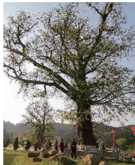
法眼寺前的千年银杏树