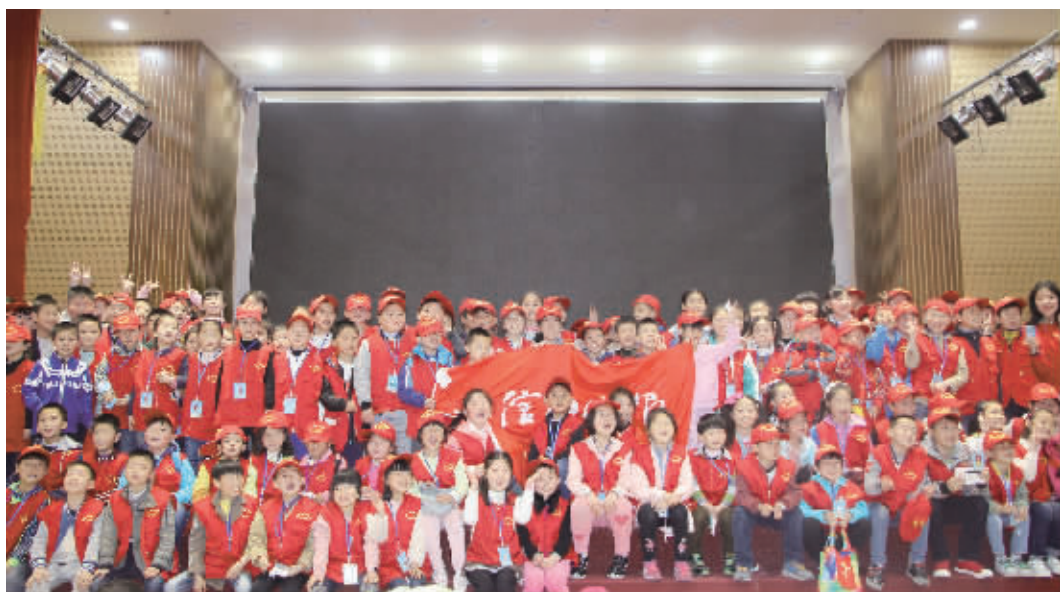
参观结束后,小记者们合影留念

信阳消息 (记者 王洋) 为了培养小记者的爱国主义精神,引导他们树立正确的世界观、人生观和价值观,4月2日上午,信阳晚报社小记者学校组织近200名小记者走进鄂豫皖革命纪念馆,开展了“缅怀革命先烈,继承光荣传统”的主题教育活动。