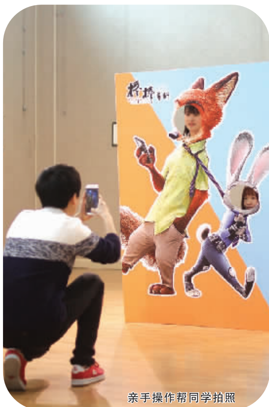
亲手操作帮同学拍照