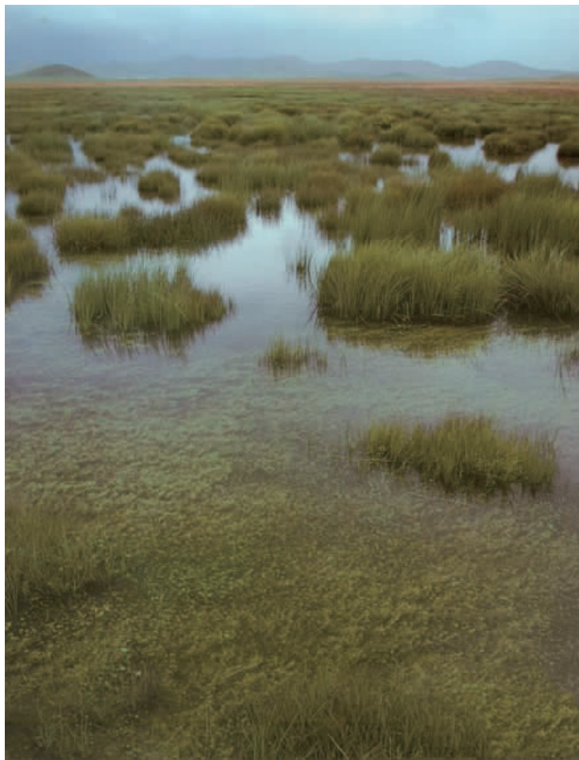
这是人迹罕至的水草地(资料照片)

长征中,红军不仅翻越了终年积雪的大雪山,而且穿越了人迹罕至的茫茫水草地。长征走过的松潘大草地,对一路征战、饥寒交迫的红军而言,几乎是一个“死亡陷阱”。