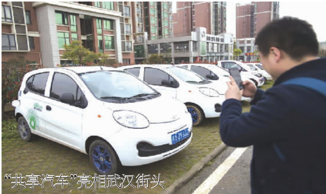
“共享汽车”亮相武汉街头

3月20日,在武汉市八一路菱角湖小区停车场,市民使用完汽车后,用手机软件上传多张“共享汽车”照片,结束用车。近日,“共享汽车”亮相武汉街头,市民可通过下载手机APP在街头定位汽车并取车使用。据悉,这批“共享汽车”均为新能源电动汽车,目前采取里程结合时间的计费方式,以1分钟0.1元时长费及1公里1元里程费的模式计价。