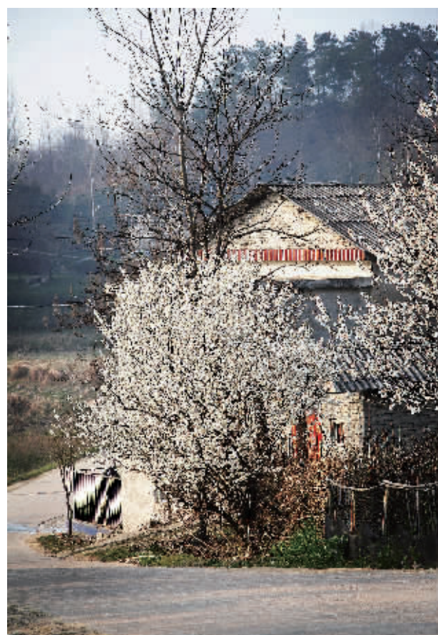
路边的花儿也灿烂

站在村里的高处,放眼望去,花表面是安静的,但当你某次转身,她们会忽然喧闹起来,争相把自己捧到人们眼前,形成大片粉白色的云霞。此情此景,不禁让人感慨:这是哪里,为何如此美好?然而就在一瞬间,被耳边传来的鸡鸣犬吠声叫醒:这是乡村,樱桃花开标志着农忙要开始了。一年又一年,她们就这样跟村里人一起,守望着冬去春来。