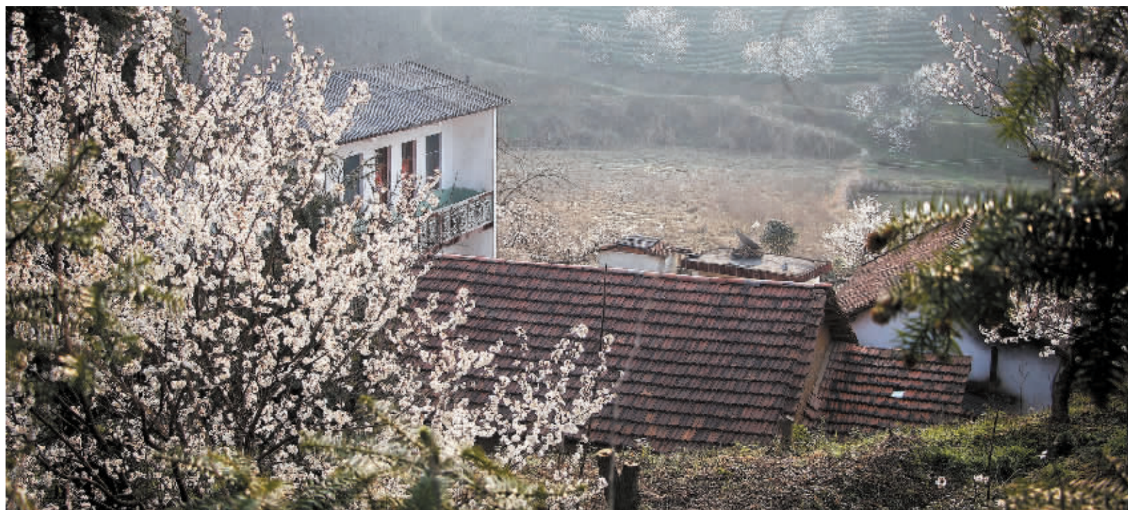
村庄被樱桃花“包围”