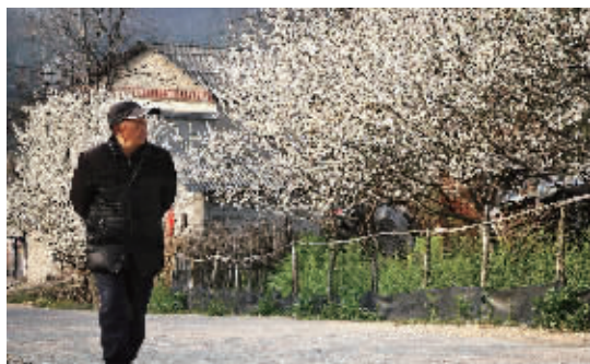
老人也忍不住驻足欣赏