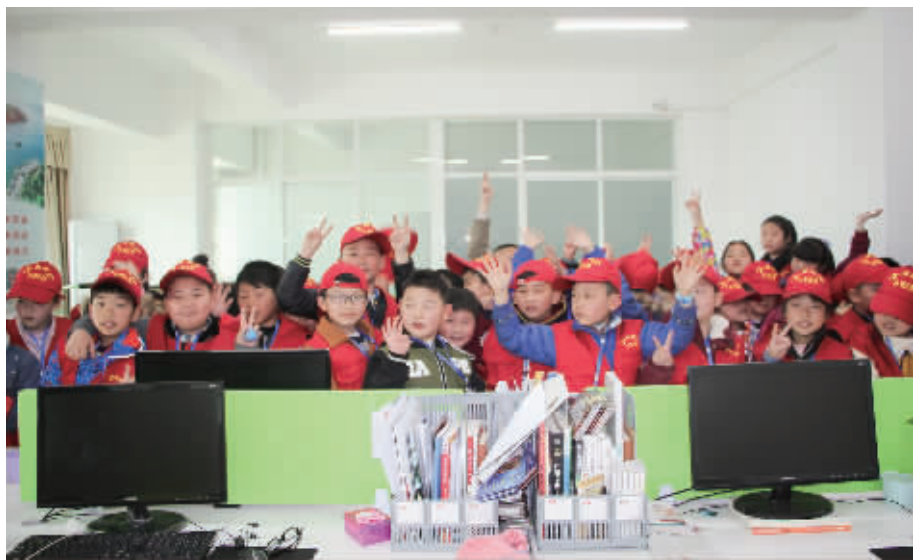
小记者们参观信阳日报传媒集团新媒体中心时的合影