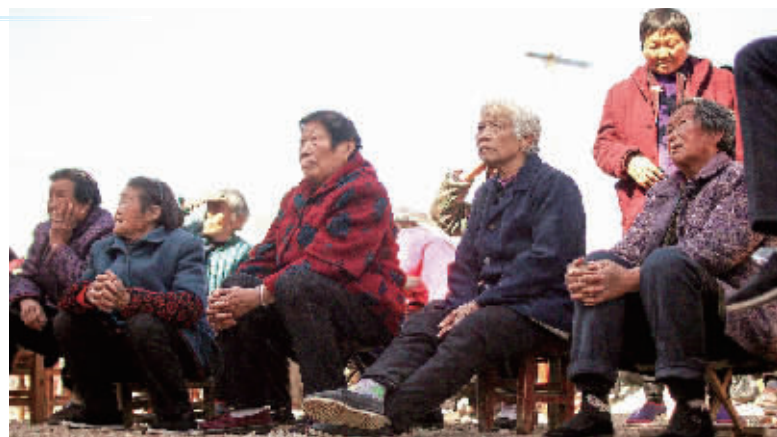
观众看得如痴如醉