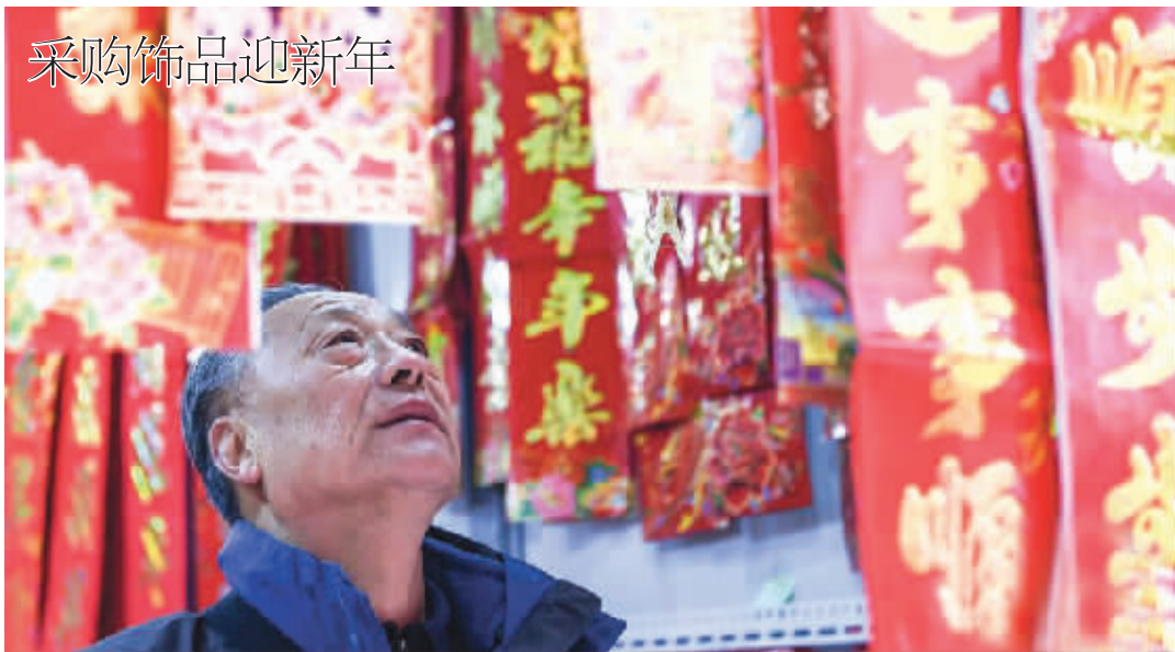
随着春节临近,河南省郑州市德化商业街附近的新春饰品摊位生意兴隆。