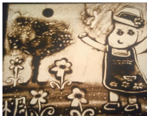
《花儿与少年》作者:陈余欣桐