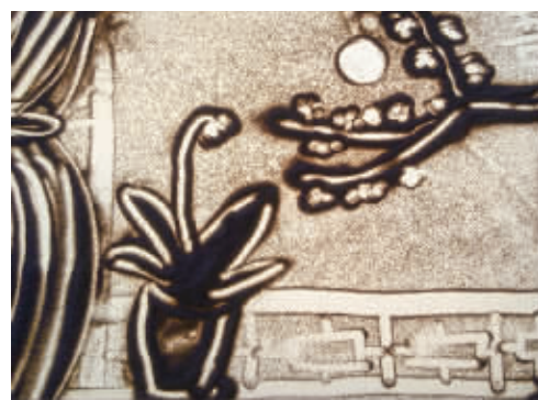
《阳台的花》作者:许吾扬