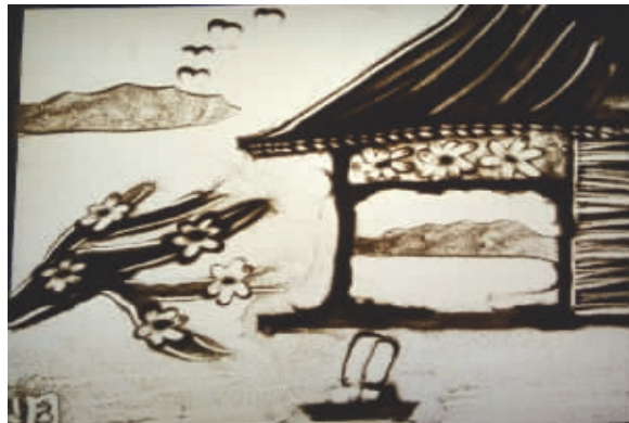
《湖心亭》作者:陈余欣桐