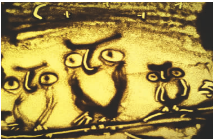
《猫头鹰》作者:马芷筱