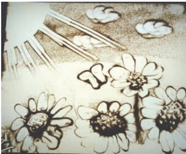
《阳光下的向日葵》作者:李绪洋

沙画是一种用沙子作画的艺术。在沙画师的手里,毫无生命的沙子变得有如行云流水,不断变换的场景让观众应接不暇。学习沙画有很多的好处:沙子的质感能够激发和发展儿童的视觉和触觉运用能力,让孩子有机会亲近大自然;能锻炼孩子的意志力和自制力,培养孩子的想象力;可以释放孩子的压抑情绪;可以有效锻炼孩子大脑发育,锻炼孩子左右手协调配合能力;能够培养孩子的艺术修养。