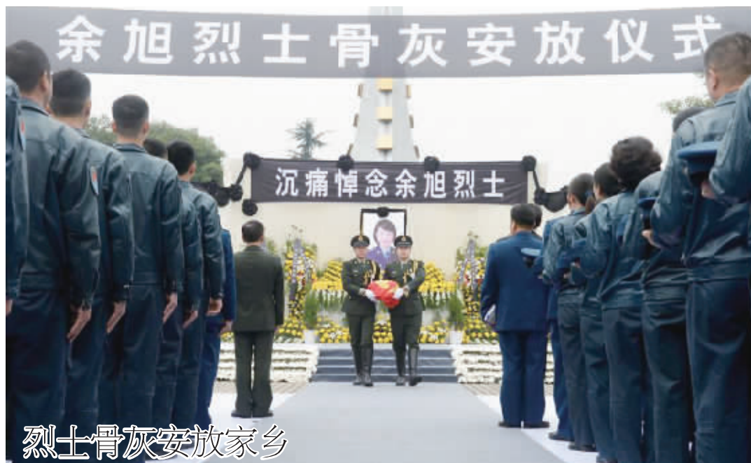
烈士骨灰安放家乡

11月20日,余旭烈士骨灰安放仪式在四川省崇州市革命烈士陵园举行。余旭是我国首批歼击机女飞行员,是首位驾驶歼-10飞机飞上蓝天的女飞行员。