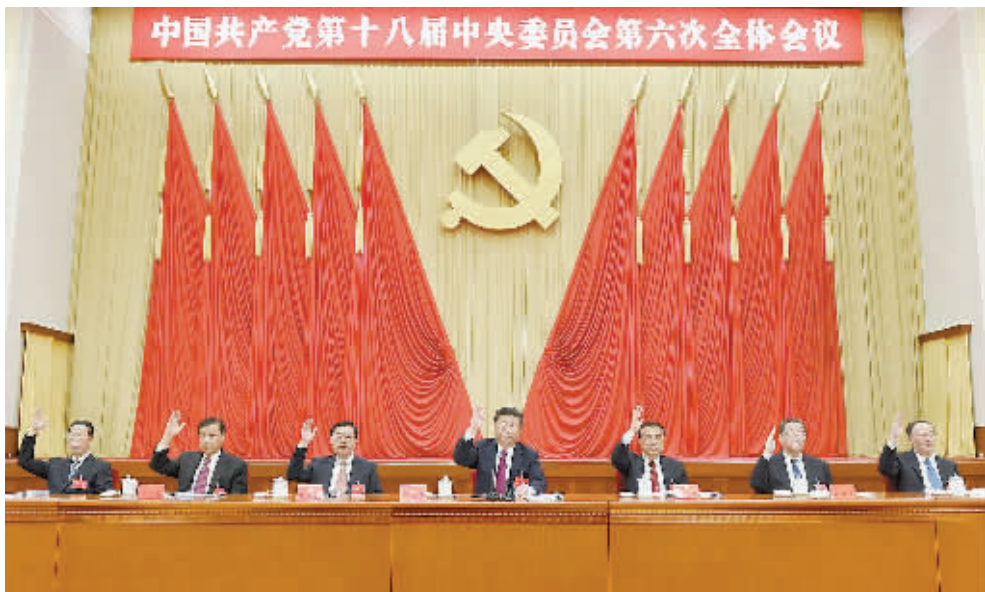
中国共产党第十八届中央委员会第六次全体会议，于2016年10月24日至27日在北京举行。中央委员会总书记习近平作重要讲话。