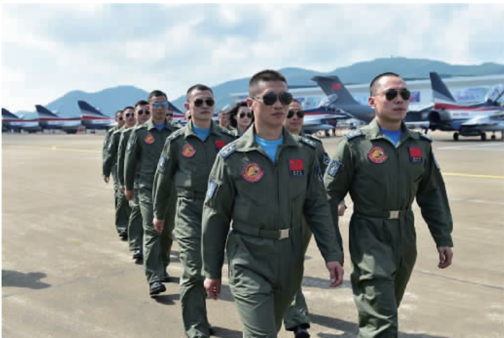
10月26日,参加第十一届中国国际航空航天博览会的中国空军“八一”飞行表演队7架歼-10战斗机抵达珠海机场。