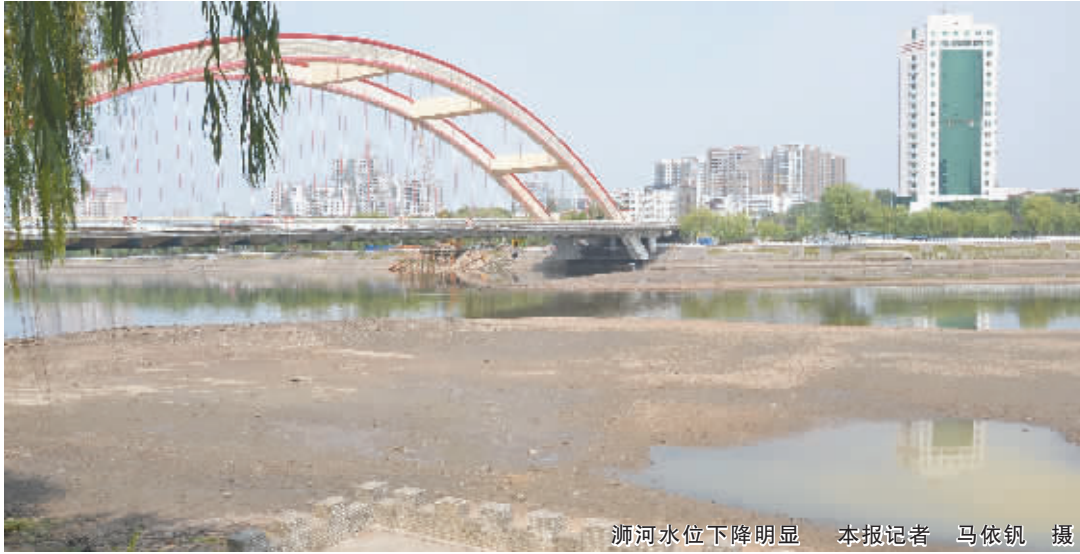
浉河水位下降明显

信阳消息(记者 马依钺)“浉河水怎么干了?”这两日,沿浉河晨练或是从市区几座桥上路过的市民发现,前几日波光粼粼的水面不见了,河水一下子少了很多。昨日,记者从相关部门了解到,为配合彩虹桥维修,附近水位已下降2米。